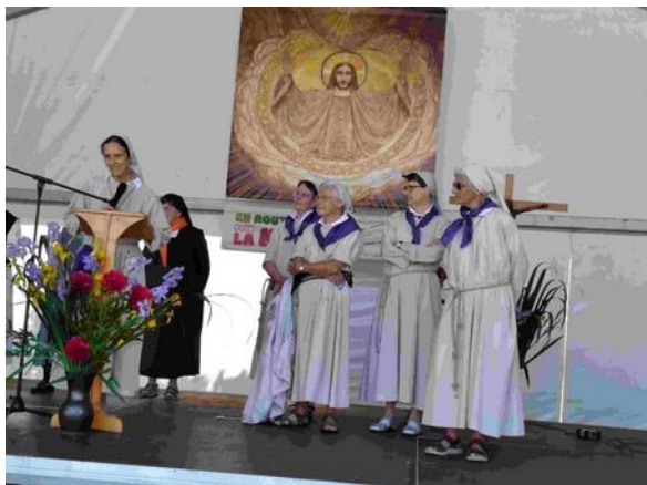
Pentecôte 2023 au Val d'Igny

Nous étions également 6 sœurs à participer au rassemblement de la journée du pèlerinage diocésain du lundi 29 mai à l'abbaye cistercienne du Val d'Igny. Quelle joie de vivre ce moment ecclésial fort où près de 1300 personnes, de tous les âges et de toutes les conditions, sont venues de tout le diocèse pour marcher ensemble, prier, réfléchir, échanger, chanter... !