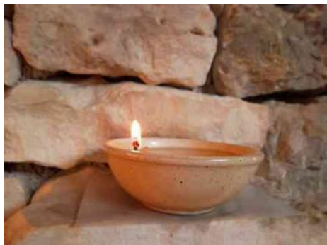
veilleuse du sanctuaire

Ayant constaté que la formule «veillée» répondait à l'attente de certaines personnes, plusieurs sœurs se sont investies dans la préparation de veillées de prière en diverses occasions au cours de l'année. Voici l'expérience de deux d'entre elles.