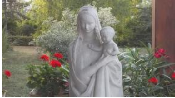
Vierge du cloître

qui se vit au cours de l'élaboration qui nécessite du temps et de l'écoute en profondeur, celle de l'Esprit Saint ainsi que celle entre nous, avant qu'on puisse accoucher du projet, fruit de la communion qui s'est vécue. La grâce de Dieu est donc déjà à accueillir